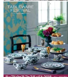
テーブルウェア・フェスティバル2018