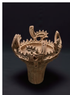
国宝 火焰型土器 新潟県十日町市 笹山遺跡出土 新潟・十日町市蔵(十日町市博物館保管)

史上初・縄文の国宝全6件集結! 国宝の「火焰型土器」や「中空土偶」をはじめ、時期や地域を超えて優品を集め、その形に込められた当時の人びとの技や思いに迫ります。