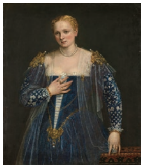
ヴェロネーゼ《女性の肖像》、 通称《美しきナーニ》1560年頃

3000年前以上も前のエジプトの棺用マスクから、ルイ14世やナポレオンなどの君主象、華麗な女性や愛らしい子どもたちの肖像まで、肖像芸術の魅力をご堪能ください。