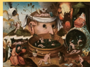
ヒエロニムス・ボス工房《トゥヌグダルの幻視》 1490-1500年頃、油彩・板 ラサロ・ガルディアノー財団

へんでこだけど、おもしろい！ 本展ではベルギーの総勢30名の作家による約500年にわたる「奇想」ともいえる系譜を約120点の国内外の優れたコレクションでたどります。