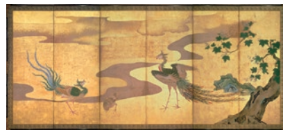
桐鳳凰図屏風 狩野探幽筆 六曲一双のうち右隻 江戸時代 17世紀 サントリー美術館