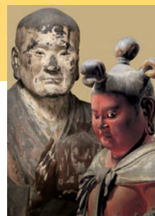
左) 国宝 無著菩薩立像【部分】運慶作 鎌倉時代・建暦2年(1212)頃 奈良・興福寺蔵 右) 国宝 八大童子立像のうち制多伽童子【部分】運慶作 鎌倉時代・ 建久8年(1197)頃 和歌山・金剛峯寺蔵