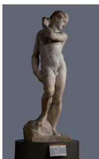
ミケランジェロ・ブオナローティ 《ダヴィデ=アポロ》 1530年頃 フィレンツェ、バルジェッロ国立 美術館蔵 Firenze, Museo Nazionale del Bargello On concession of the Ministry of cultural heritage and tourism activities.

本展では、世界に全部で約40点しか現存しないミケランジェロの大理石彫刻のうち、傑作《若き洗礼者ヨハネ》と《ダヴィデ=アポロ》を日本初公開すると共に、古代ギリシャ・ローマとルネサンスの作品約70点により、ミケランジェロや同時代の芸術家たちが創りあげた、理想の身体美の表現に迫ります。