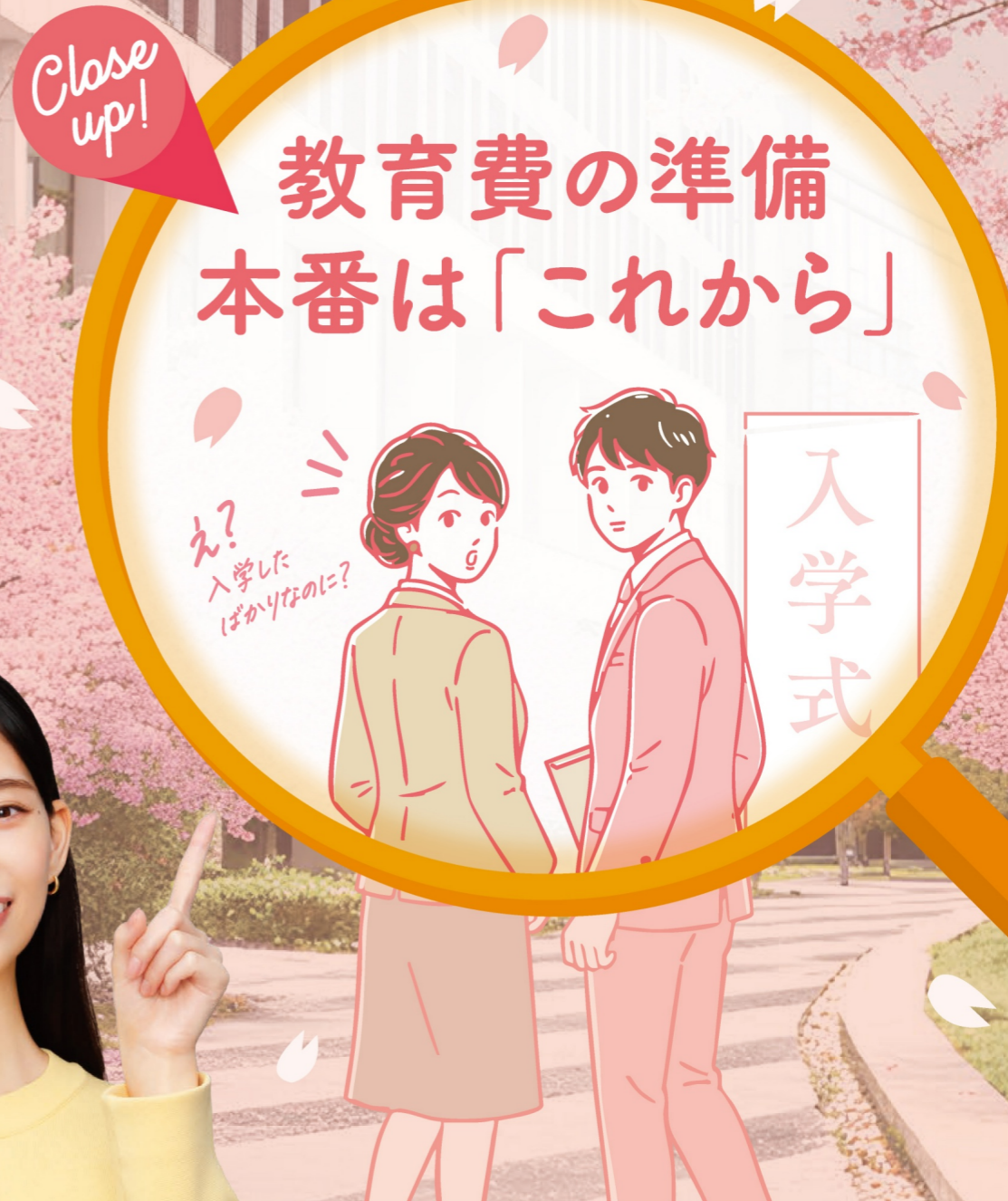
ろうきんイメージモデル 森川葵